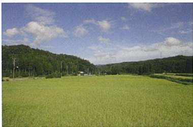
→昔ながらの里山の田園風景

能登最大規模のブナ林や石動山、肩丈山に囲まれた一面に広がる田園風景。ゆったりとした時間が流れる癒やしの暮らし。近年、宅地造成も進み、子育て支援も充実しており、若年層の移住も増加中。